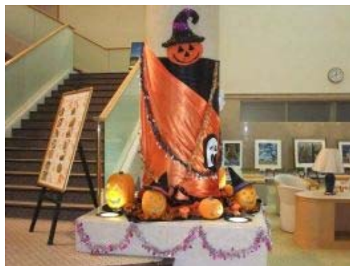
「ハーモニーヒルズゴルフクラブ」