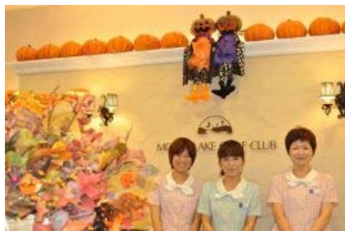
「ムーンレイクゴルフクラブ」