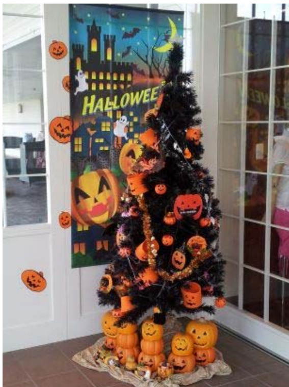
「イーグルレイクゴルフクラブ」

ゴルフでも「ハロウィン」気分を味わってもらおうと、PGM では、「イーグルレイクゴルフクラブ」(千葉県山武郡)「ムーンレイクゴルフクラブ」(千葉県茂原市)、「ハーモニーヒルズゴルフクラブ」(栃木県栃木市)で、「ハロウィン」に向けて、クラブハウス内に多数のデコレーションを施し、皆さまのご来場をお待ちしております。