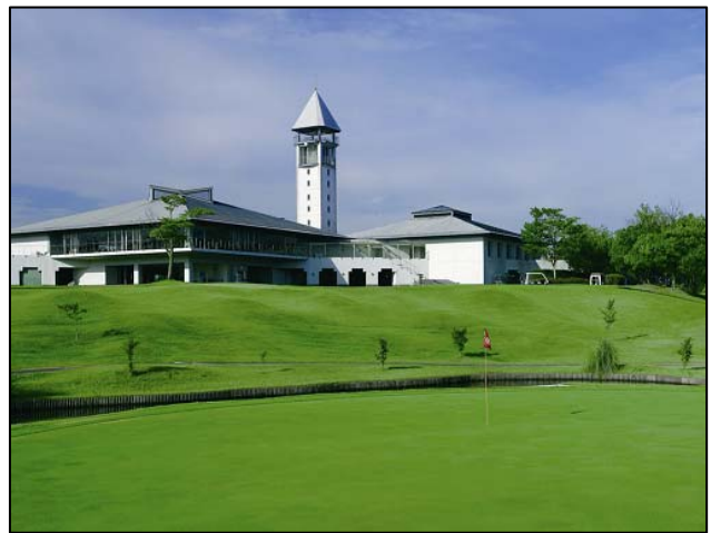
20 周年を迎える花の木ゴルフ倶楽部