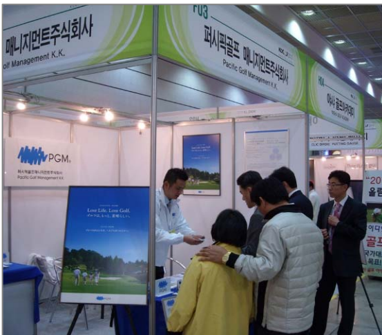
会期中の PGM ブースの様相

PGM では、2010 年 4 月 8 日～11 日に韓国ソウル市で開催された韓国最大級のゴルフ展示会『KOGOLF 2010』（正式名称：『2010 韓国ゴルフ総合展示会』）に展示ブースを出展しました。PGM ブースでは、先日オープンした韓国語版 WEB サイトのオープンキャンペーンの告知とメール会員登録の促進を行い、当初の目標を大きく上回る方々からご登録をいただきました。イベント自体も、韓国におけるゴルフブームの高まりを反映し、会期中の 4 日間で前年を上回る延べ 81,738 人ものゴルフファンが会場を訪れるなど、大いに盛り上がりました。