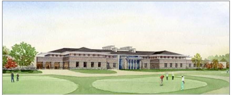
新クラブハウスイメージパース