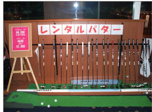
お手軽価格で 1 本からお借りいただける充実した品揃えの「ザ・ゴルフクラブ竜ヶ崎」パターコーナー