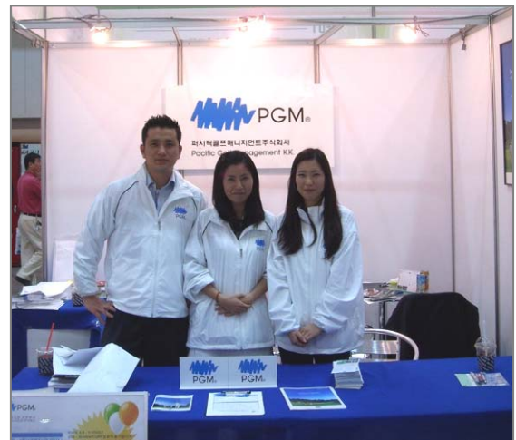
会期中多くのゴルフファンを出迎えたスタッフ

また、イベント出展に先駆けて韓国企業へのエージェント営業を実施したほか、イベント前日に行った現地韓国の経済紙記者やゴルフ記者との懇親会を通して、韓国メディアの皆さまとのリレーションをより深めることが出来、今後 PR を進めていく上での足掛かりを築くことができました。