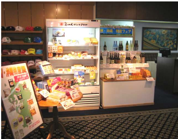
プロショップの一角に登場したご当地物産展は大好評