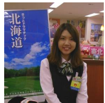
ご来店をお待ちしております