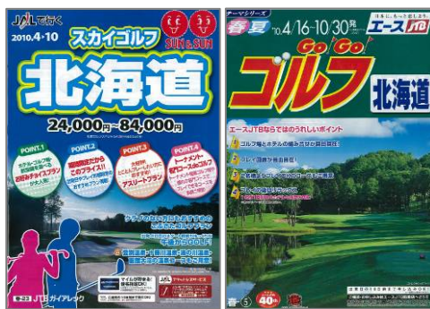
JTB が取り扱う 北海道ゴルフ宿泊パック商品