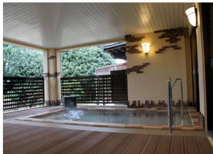
改修後新たに誕生した外風呂