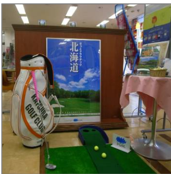
JTB 神保町店内 PGM 北海道コーナー

同コーナーは今後、JTB 銀座店にもオープンする予定で、これから本格シーズンを迎える北海道ゴルフを、東京を中心とする関東地域にお住まいの方にもっとアピールして、営業を強化していきます。