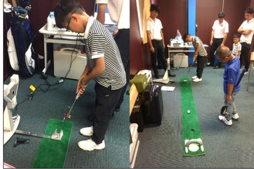
パットラボを利用した計測（昨年合宿）