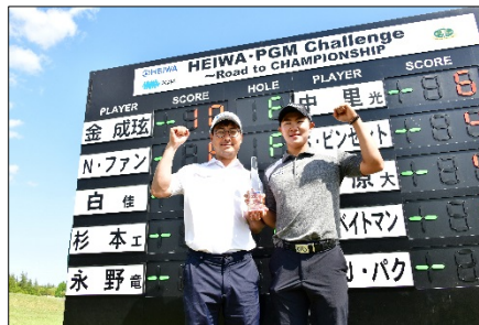
キム選手とキャディーのお父様