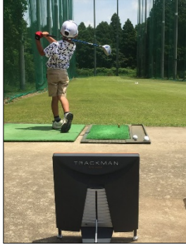
トラックマンを利用した計測（昨年合宿）

この合宿の参加選手は、今年2月から4月の間に全国のPGM運営ゴルフ場で開催された『PGM世界ジュニアゴルフ選手権 日本代表選抜大会』の各予選・決勝大会で優勝・準優勝したジュニアゴルファーで、昨年の世界大会では優勝者も出たほどの実力者が揃っています。合宿では、練習ラウンド、講義のほか、「トラックマン」を使用した、ヘッドスピードやスピン量、飛距離などの専門的な数値の測定や、「パットラボ」によるパッティング診断など、個人の強み・弱みを徹底的に洗い出し、世界大会へ向けた最終調整を行います。ご取材も可能なのでご希望の方はぜひご連絡ください。