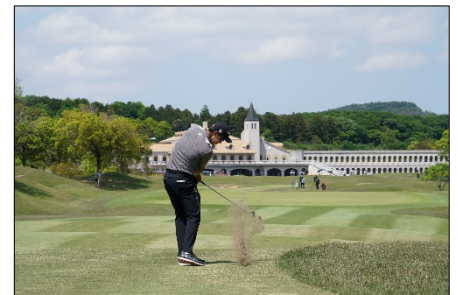
プレー中のキム選手の様子