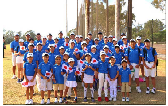
集合写真（昨年世界大会）