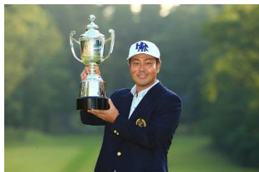
優勝トロフィーを掲げる 谷原秀人選手

また、今年も予選 1 日目から最終日までの 4 日間を通して、BS 朝日でのテレビ生放送やインターネット生放送を行ないました。なお、今大会では、コース外でも大会をお楽しみいただけるよう、ギャラリープラザ内にサテライトスタジオを設け、インターネット放送の様子をオーロラビジョンで放映し、好評を博しました。開催期間中のギャラリー数は、本大会過去最高となる合計 14,353 名様にご来場いただきました。