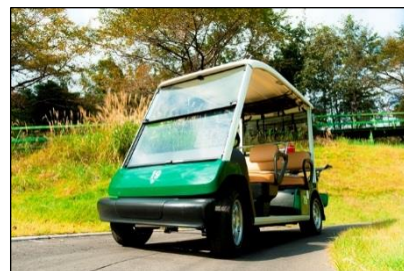
乗用カートを全台一新！！

「大秦野カントリークラブ」のリニューアルの詳細は、下記専用 Web ページよりご確認ください。