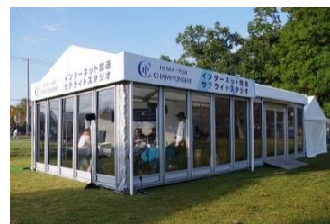
インターネット放送 サテライトスタジオ