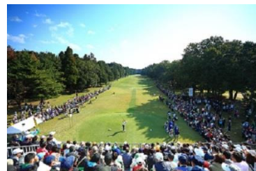
18 番ホール ギャラリースタンドの様子