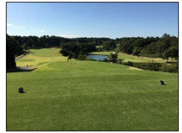
オーバーシード後のコース画像 (2016年11月撮影)

※オーバーシードとは、寒冷気候型の芝種を秋期に撒布育成し、翌年の春期～初夏に、寒地型芝生から暖地型芝生に切替えることで、通年緑の芝生を維持する技法です。