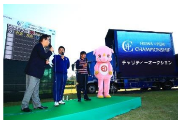
チャリティオークションの様子