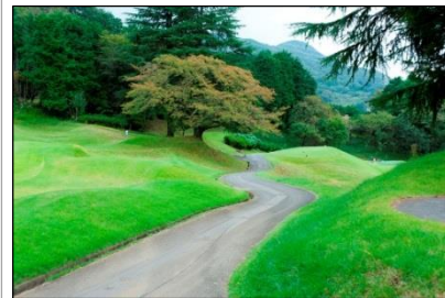
新設されたカート道

「伊勢原カントリークラブ」のリニューアルの詳細は、下記専用 Web ページよりご確認ください。