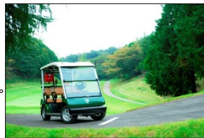
最新の乗用カートを導入

「伊勢原カントリークラブ」（神奈川県伊勢原市）では、カート道改修工事が完了し、11月1日（火）より、乗用カートプレーを開始しました。このカート道の新設にともない、旧大山コースを『アウトコース』、旧アウトコースを『インコース』、旧インコースを『南コース』に名称変更し、『南コース』を除く 18H を乗用カートプレーで営業しています。また、2017年2月には、新たに GPS ナビの導入により、セルフプレーもお楽しみいただける予定です。