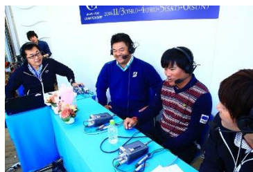
インターネット放送の様子