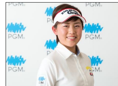
女子プロゴルファー 岡村 咲 (おかむら さき)