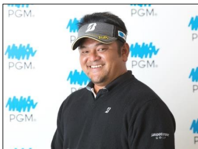
男子プロゴルファー 宮里 聖志 (みやざと きよし)

http://www.pacificgolf.co.jp/miyazato_k/