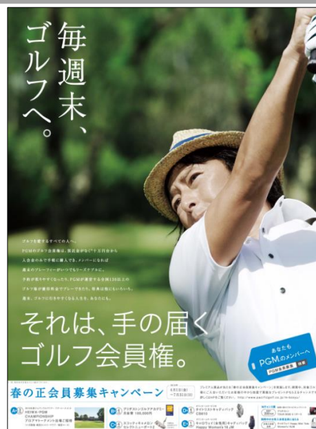
会員募集ポスター画像

http://www.pacificgolf.co.jp/membership/campaigns/spring2016/