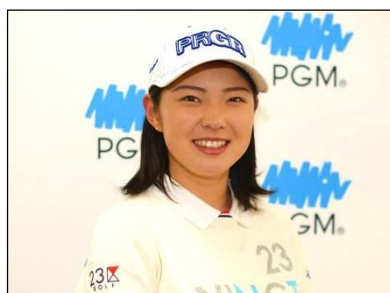
女子プロゴルファー 辻 梨恵 (つじ りえ)