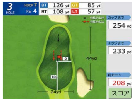
カップの位置やヤードージの表示画面