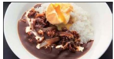
「坂井 宏幸 シルクのハヤシライス」

5 種類のチーズが入ったハンバーグにやわらかなビーフが添えられ、坂井氏のオリジナルソースは、チーズと相性が抜群です。