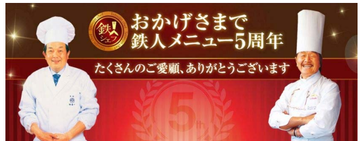
陳 建一氏(左)・坂井 宏行氏(右)