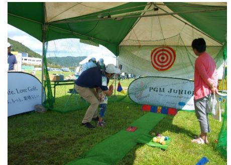
昨年の PGM 企業協賛ブース内スナッグゴルフ体験の様子