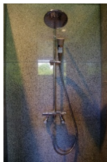
一新されたシャワー設備