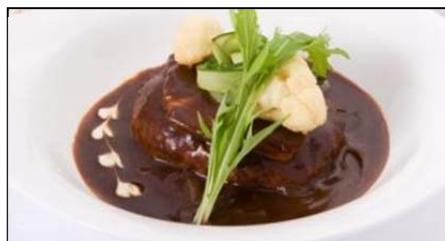
「チーズ in デミバーグ やわらかビーフ添え」

根菜類を多く取り入れ、三元豚は味わい豊かな山形県産を使用し、ほんのり甘めの味付けに生姜の風味が程良いアクセントとなっています。