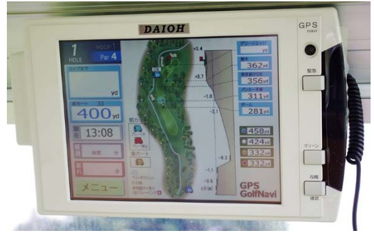
導入された最新ゴルフカートGPSナビ

また、スコアを入力すると順位が一目でわかるリアルタイムリーダーズボード機能が搭載されているので、1組でのプレーはもちろん、特にコンペ開催時の盛り上げの一助としても期待しています。