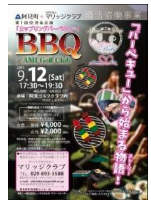
「婚活イベント」チラシ

PGM グループ運営ゴルフ場では、今後も地元自治体と協力し、地域に根付き、開かれたゴルフ場の運営を行ってまいります。