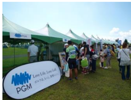
昨年の PGM 企業協賛ブースの様子