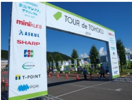
昨年のゴールゲートに掲示された協賛ロゴ

■『ツール・ド・東北 2015』の詳細は、下記公式ホームページよりご確認ください。 http://tourdetohoku.yahoo.co.jp/