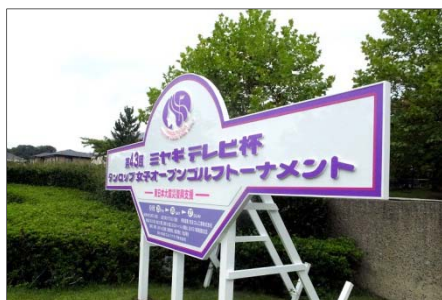
進入路脇に設置された大会看板