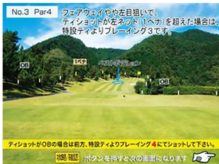
コース攻略の表示画面