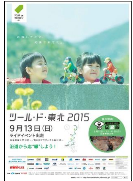
『ツール・ド・東北 2015』大会ポスター

PGM グループは全国にゴルフ場を保有・運営し、東北地方のゴルフ場も東日本大震災の被害を受けた経験から、同じスポーツを通じて被災地の東北地方を支援する本大会に賛同し協賛することで、東北地方へ復興支援を行います。