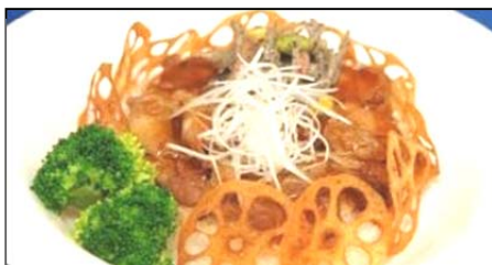
「三元豚の生姜焼きライス」