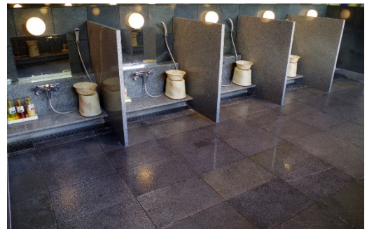
カランになった洗い場のシャワー