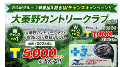
「大秦野カントリークラブ」キャンペーンページ画像