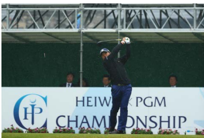
大会ホストプロの宮里優作選手 最終日ティショットの様子