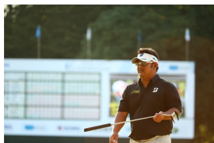
大会ホストプロの宮里聖志選手 初日ホールアウト時の様子