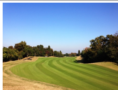
オーバーシード後の 7 番ホール画像 (2014 年 11 月撮影)

※オーバーシードとは、冬季休眠する夏芝の隙間に冬芝を育成させることで、年間を通して緑の天然芝を保つ技法。