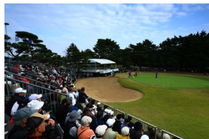
18番ホール ギャラリースタンドの様子