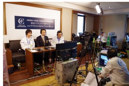
インターネット動画配信ブースの様子