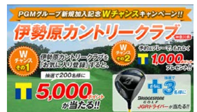
「伊勢原カントリークラブ」キャンペーンページ画像

http://booking.pacificgolf.co.jp/campaign/playstyle/2015101/