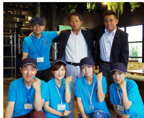
『OUTDOOR SPORTS PARK』スタッフ

PGM が運営する総合アウトドアリゾート施設『OUTDOOR SPORTS PARK』(埼玉県吉川市) では、昨年6月のグランドオープン以来、ゴルフやバーベキュー・サイクリング・ランニングなど、アウトドアを愛するたくさんの方に施設をご利用いただいておりますが、この度、お客様満足度向上と、施設をより手軽にご利用いただくため、施設内で販売するフードメニューを、本日7月1日(水) から一新いたしました。