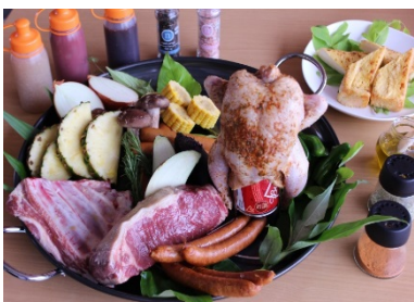
(写真は 4 人前イメージです)