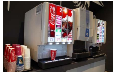
ソフトドリンクバー300円(税込)