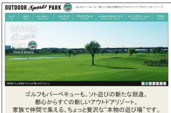
公式 Web サイト

フードメニューの一新に伴い、『OUTDOOR SPORTS PARK』の公式 Web サイトおよび公式 Facebook ページをリニューアルいたしました。今後、ゴルフ、BBQ、カフェと、さまざまな角度から情報を発信してまいりますので、ご期待ください！