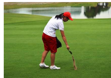
ショット後の目土など、「エチケットやマナー」も学ぶことができます

http://juniors.pacificgolf.co.jp/advance/tournament_adsm2015.asp