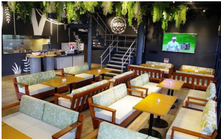
ソフトドリンクバーや大型 TV モニターの設置でさらに快適でくつろげる空間に！