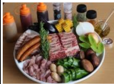
(写真は 4 人前イメージです)