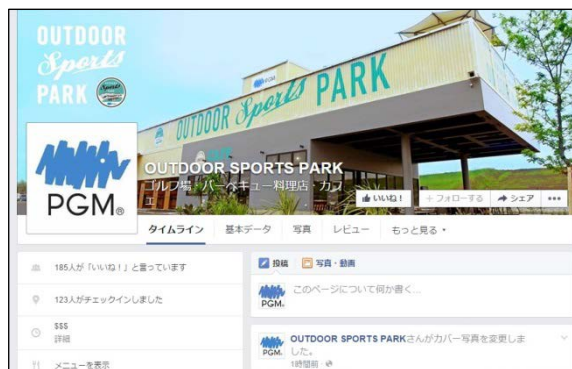
公式 Facebook ページ