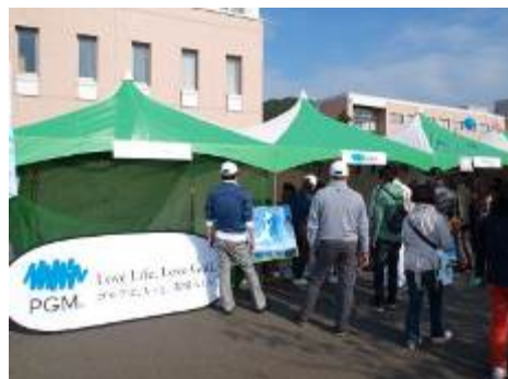
昨年のPGM企業協賛ブースの様子