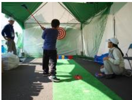
昨年のPGM企業協賛ブース内スナッグゴルフ体験の様子