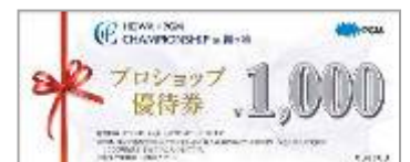
プロショップ優待券(1,000円)

http://heiwa-pgm-championship.jp/ticket.html