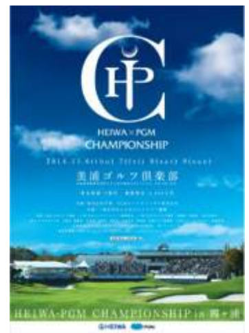
「HEIWA・PGM CHAMPIONSHIP in 霞ヶ浦」大会ポスター

※2 山武グリーンカントリー倶楽部(千葉県山武市)、赤穂国際カントリークラブ(兵庫県赤穂市)では、PGM プロショップ優待券のご利用はできません。