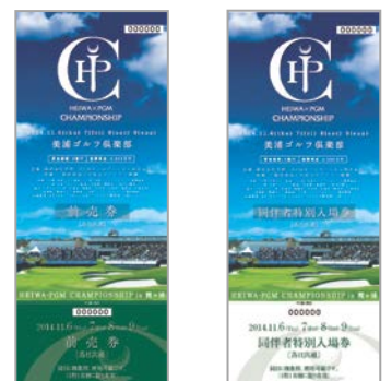
前売券(左)・同伴者特別入場券(右)