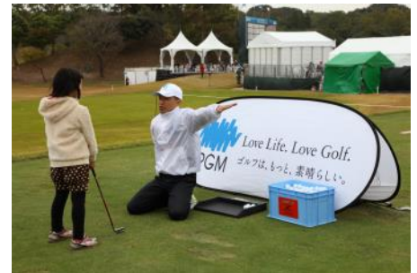
昨年の「ゴルフ体験会」実施の様子