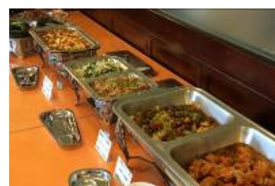
エヴァンティユゴルフクラブ ランチバイキングメニュー一例

PGMでは、年間を通してランチバイキングを実施しているゴルフ場が全国で8箇所あり、ご来場のお客さまに大変ご好評をいただいています。9月1日からは、新たに「エヴァンティユゴルフクラブ」(栃木県栃木市)が、30種類以上のメニューをお楽しみ頂ける、ランチバイキング&フリードリンク制(生ビール等のアルコール類を含む)を導入しています。ランチバイキングを導入しているゴルフ場では、ゴルフプレーのお客さま以外に、一般の方のご利用も可能となっています。