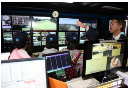
昨年の放送センター見学の様子