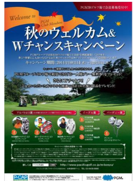
「秋のウェルカム&Wチャンスキャンペーン」ポスター画像

また、補充会員募集と並行して、市場で売買されているPGMグループ運営ゴルフ場会員権の名義変更料に、預託金の一部または全部を充当可能な「預託金充当制度」や、名義変更料が減額となる「名義変更料減額プラン」によるご入会手続きも継続実施しています。※2