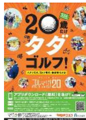
「ゴルマジ! 20」ポスター画像