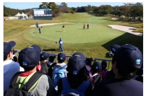
昨年の18番ホール、スタンド観戦の様

・「PGM JUNIORS」のジュニアイベント専用WEBページで昨年の様子をご覧いただけます。