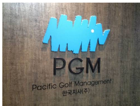
韓国オフィス入口看板