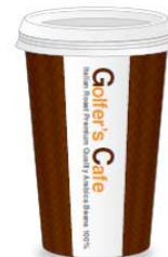
「PGM オリジナル テイクアウトコーヒー」 専用カップ

本日 2012 年 4 月 4 日(水)より、PGM の全国 29 箇所のゴルフ場にて、お客様満足度向上の一環として、「PGM オリジナルテイクアウトコーヒー」(300 円/税込)の販売を順次開始いたしました。【レインフォレスト アライアンス】認証※で、ほどよい苦味と濃厚な味わいが特徴のコーヒー豆を採用し、イタリアンローストで焙煎した香り深い、コクのある味わいとなっております。クラブハウスフロントにて専用カップを購入後、オリジナルワゴンに設置のコーヒーブルーワーにて挽き立てのコーヒーをご用意しております。焙煎豆の香り漂うクラブハウスにて、プレーの前後に優雅な時間をお過ごしいただくと共に、コース内へのお持込やお帰りの車中とのお供として、挽き立てコーヒーをお楽しみください。